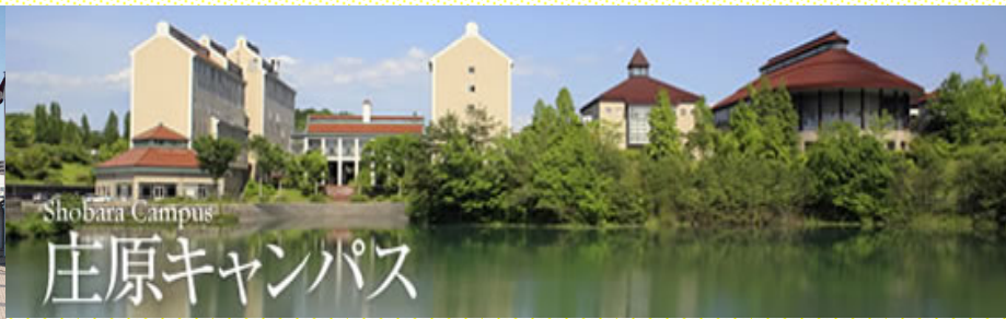
แคมปัสโชบาระ