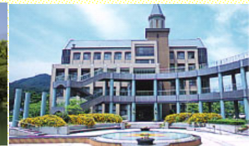
แคมปัสมิฮาระ